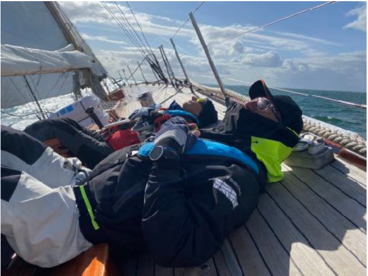
An Kalkgrund vorbei in die Bucht bei Horuphav , eine der schönsten Ankerbuchten in der dänischen Südsee.